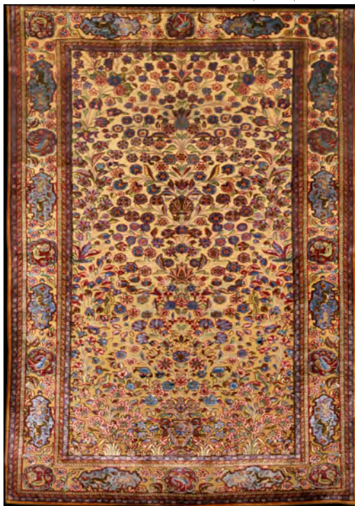
تصویر ۱۴: قالیچه طرح یکدوم، افشان گلدانی، اوایل سده چهاردهم/ بیستم، کاشان، ۲۰۷ × ۱۳۲ سانتی‌متر