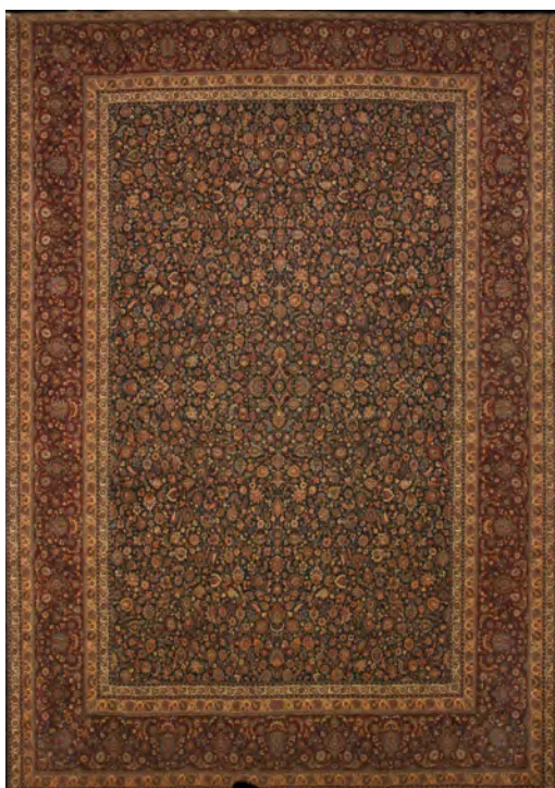
تصویر ۶: قالی طرح یک چهارم، افشان، اوایل سده چهاردهم/ بیستم، مشهد، ۳۶۹ × ۲۶۶ سانتی متر