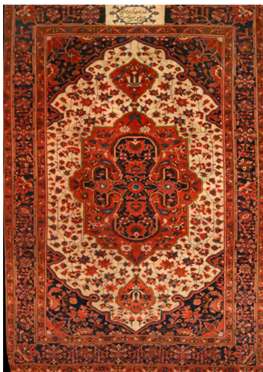
تصویر ۲: قالیچه طرح یک چهارم، لچک ترنج (ختایی)، ۱۳۱۸/۱۹۰۰، ساروق، ۲۱۰ × ۱۴۴ سانتی متر