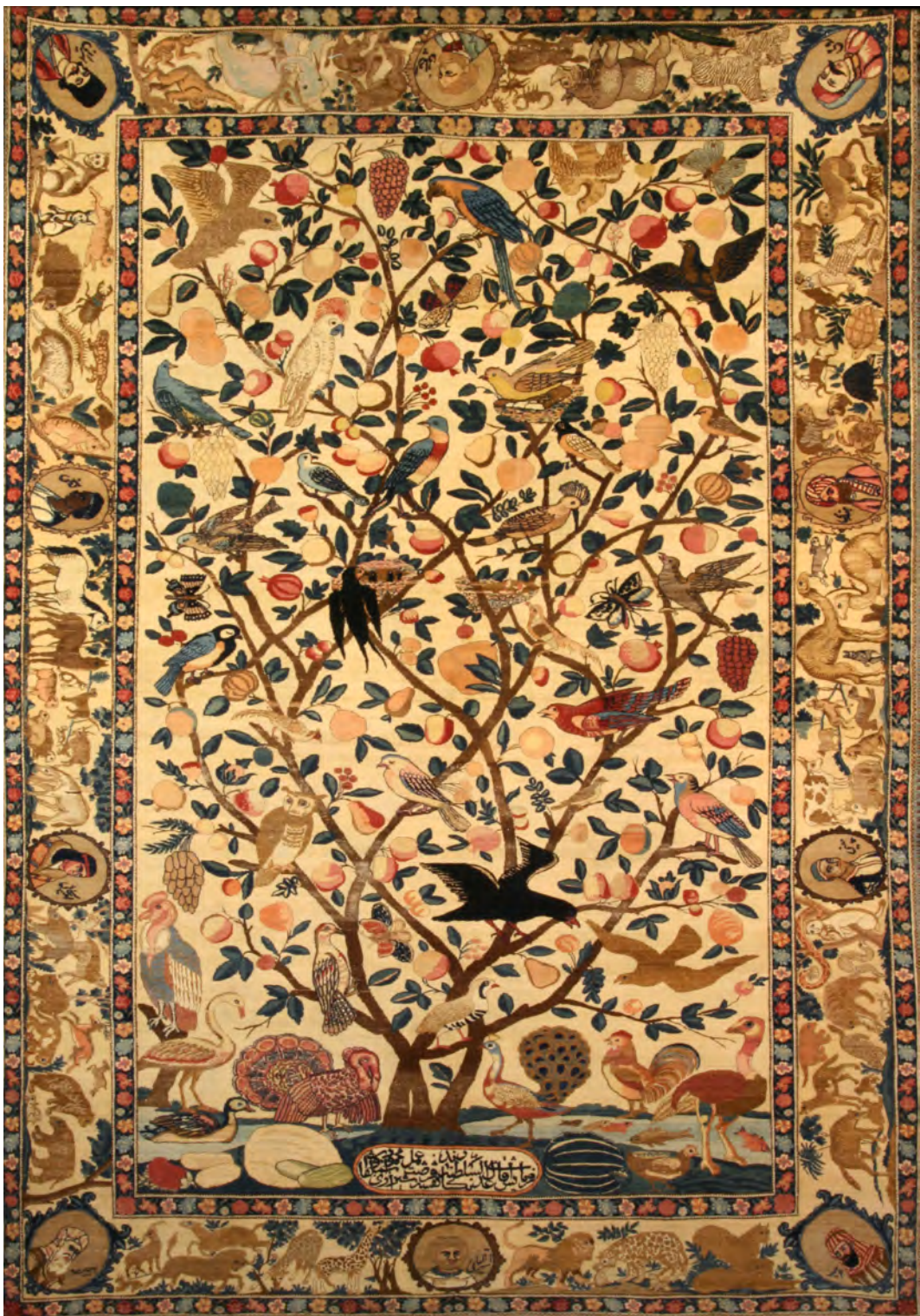
تصویر ۱۶: قالی طرح سراسری، درختی (ملیت)، اوایل سده چهاردهم/ بیستم، کرمان، ۲۸۸ × ۱۷۶ سانتی متر