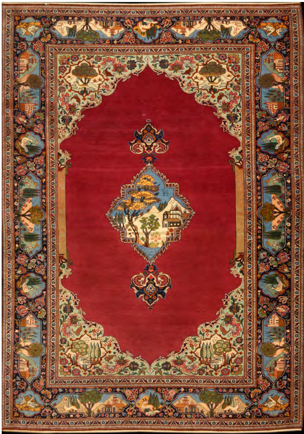
تصویر ۴: فالپچه طرح یک چهارم، لچک ترنج (کف ساده)، اوایل سده چهاردهم/نوزدهم، کاشان، ۱۹۵ × ۱۳۵ سانتی متر