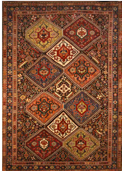
تصویر ۹: قالیچه طرح واگیره، قابی، اوایل سده چهاردهم / بیستم، قشقای، ۲۷۲ × ۱۴۵ سانتی متر