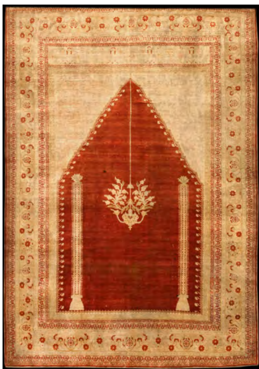
تصویر ۱۲: قالیچه طرح یکدوم، محرابی قندیل‌دار (سجاده‌ای)، اواسط سده سیزدهم/ نوزدهم، درخش، ۲۳۲ × ۱۵۲ سانتی‌متر