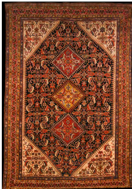
تصویر ۳: قالیچه طرح یک چهارم، لچک ترنج (ماهی درهم)، اوایل سده چهاردهم / نوزدهم، قشقایی، ۲۷۲ × ۱۴۵ سانتی متر (مأخذ: نگارنده)