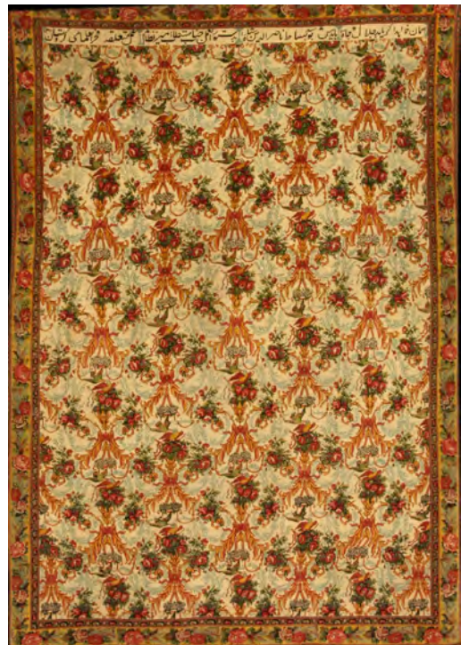
تصویر ۸: قالیچه طرح واگیره، گلفرنگ، ۱۸۹۲/۱۳۱۰، سنه (سندج)، ۲۲۴ × ۱۶۵ سانتی متر