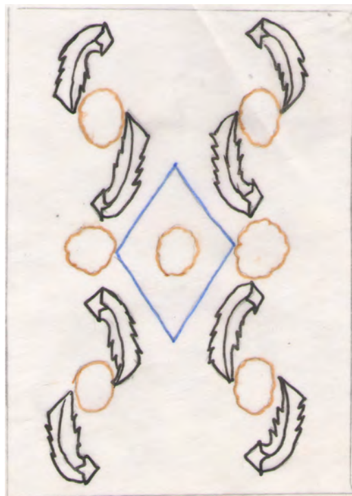
تصویر ۳-۱: واگیره ماهی درهم، بخشی از تصویر ۳