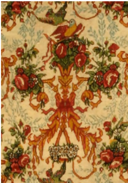
تصویر ۸-۱: واگیره طرح (تصویر ۸) حاوی نقش مایه گلفرنگ