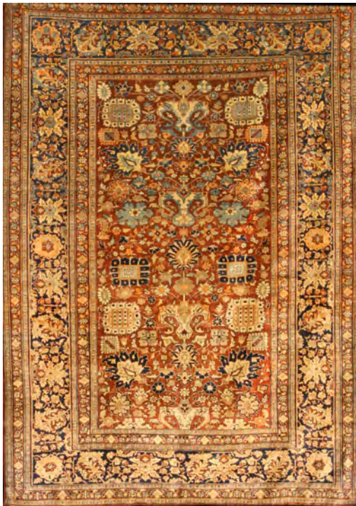
تصویر ۱۰: قالیچه طرح واگیره، گلدانی شاه عباسی، اواخر سده سیزدهم / نوزدهم، تبریز، ۱۷۴ × ۱۳۶ سانتی متر