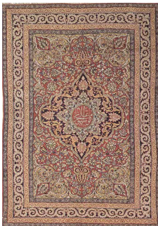
تصویر ۱: قالیچه طرح یک چهارم، لچک ترنج (ختایی)، ۱۳۱۸/۱۹۰۰، راور کرمان، ۱۹۸ × ۱۲۲ سانتی متر