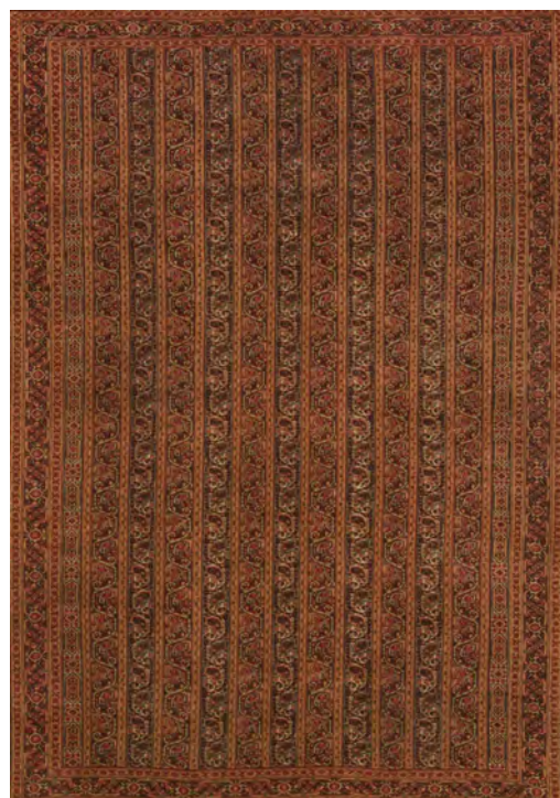
تصویر ۱۱: قالیچه طرح واگیره، محرمات، اواسط سده سیزدهم/ نوزدهم، درخش، ۲۳۲ × ۱۵۲ سانتی‌متر