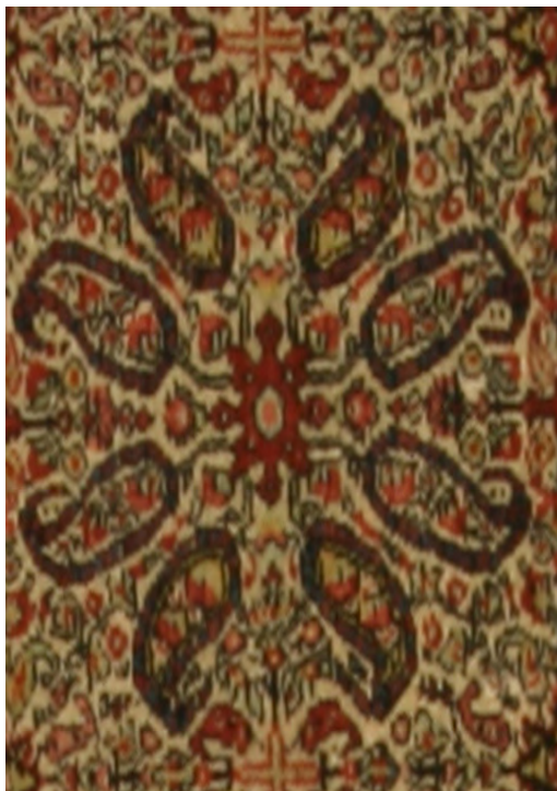
تصویر ۷-۱: واگیره طرح (تصویر ۷)، هشت به