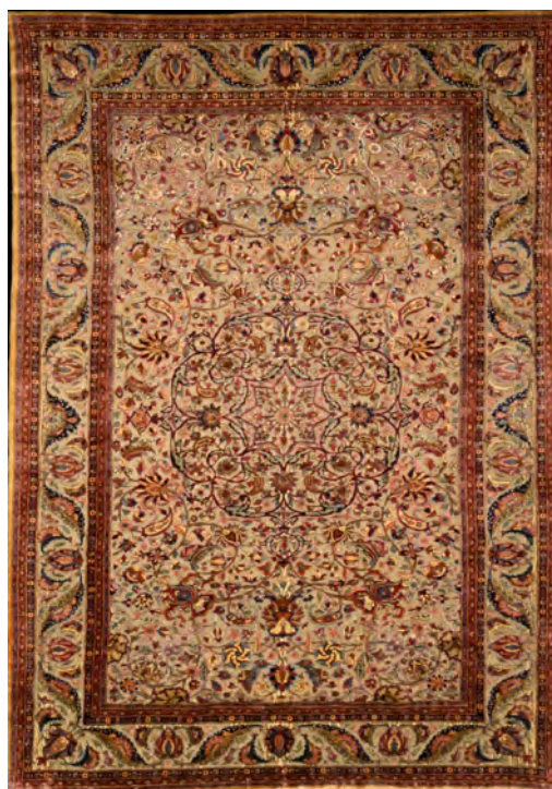
تصویر ۵: قالیچه طرح یک چهارم، ترنجی، سده سیزدهم/ نوزدهم، کاشان، ۲۰۰ × ۱۲۹ سانتی متر