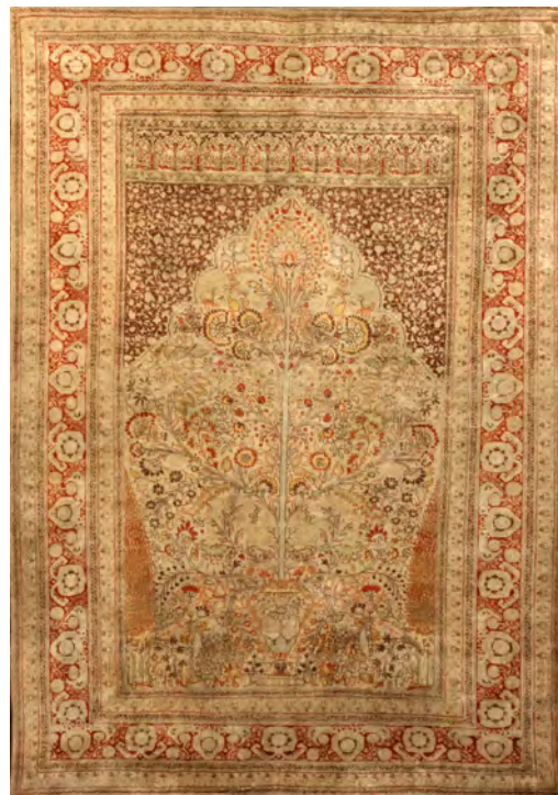
تصویر ۱۳: قالیچه طرح یکدوم، محرابی گلدانی، اواخر سده سیزدهم/ نوزدهم، هرکه تبریز، ۱۷۰ × ۱۳۰ سانتی‌متر